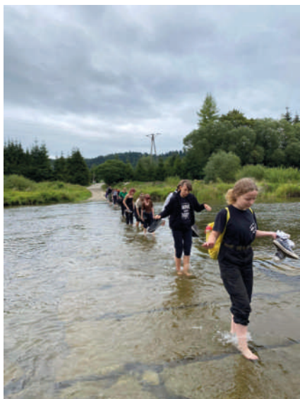
Na bieszczadzkiem szlaku...

Po raz kolejny KLKS Lider Sztum podjął się organizowania rajdów rowerowych po Ziemi Sztumskiej.