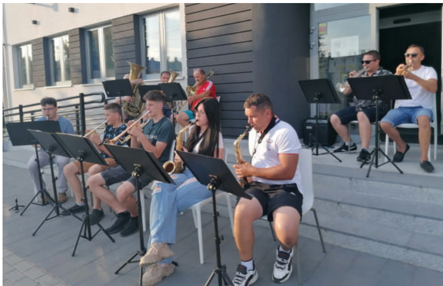
Sztumska Orkiestra Dęta wychodzi do publiczności z rozrywkowym repertuarem.

W tym roku zaplanowano 3 imprezy, w tym zrealizowany w lipcu rajd nocny. Uczestnicy rajdów mają możliwość połączenia aktywnego spędzania czasu i zwiedzania uroczych zakątków naszej gminy, która inaczej prezentuje się z pozycji rowerzysty. Każdy rajd kończy się ogniskiem oraz losowaniem upominków wśród uczestników.