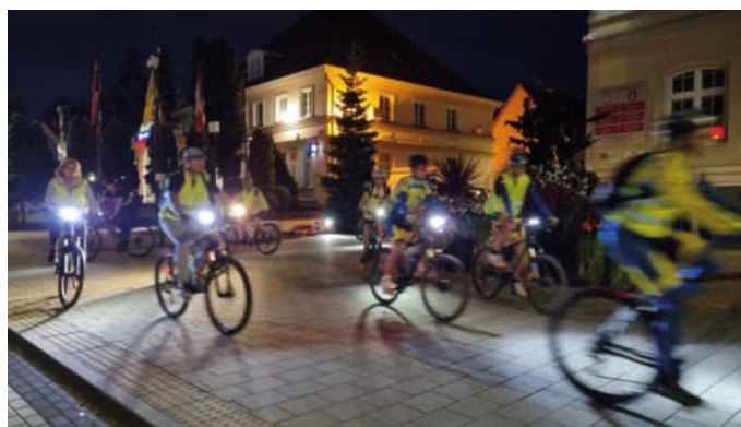
Nocny rajd zorganizowany przez KLKS Lider Sztum.