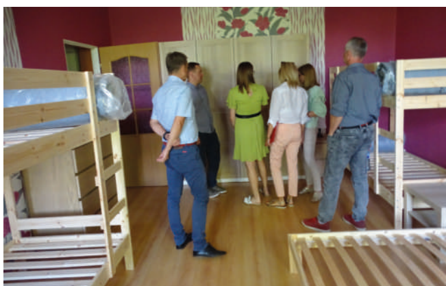
Radni w mieszkaniu przygotowanym dla uchodźców z Ukrainy.