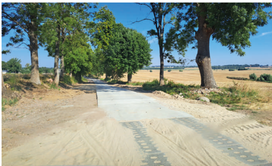
Modernizowana droga Czernin - Ramzy Mate.

tymczasowe lokale przygotowane dla uchodźców z Ukrainy, przebywających na naszym terenie. Ich wyposażenie było możliwe m.in. dzięki wsparciu finansowemu miast partnerskich - Val de Reuil i Ritterhude.