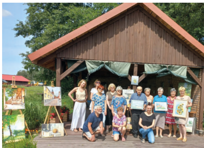
Członkowie Stowarzyszenia Plastyków Paleta w Klimbergowicach.