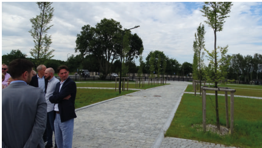
Nowa część cmentarza Parlety. Ma pełnić swoje funkcję przez kolejnych 40 lat.

Przejazd jumbostradami m.in. przez Sztumskie Pole pokazał raz jeszcze, jak ważna była decyzja sprzed kilku