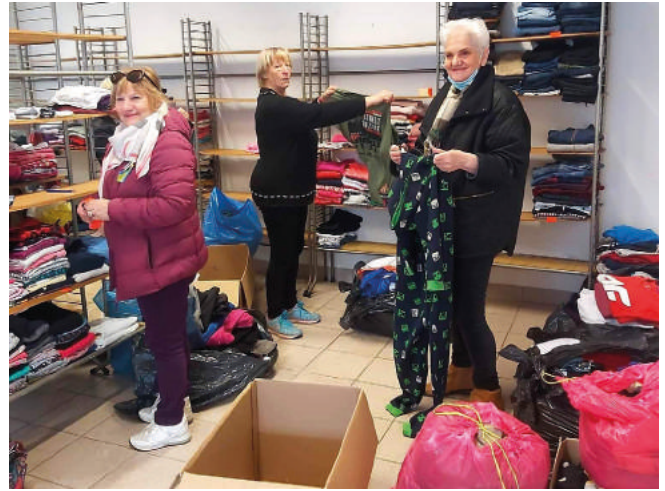
Panie z Klubu Amator Senior+ w magazynie.