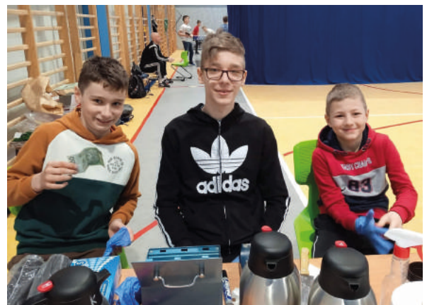
Stodki kiermasz w Zespole Szkół w Gościszewie.