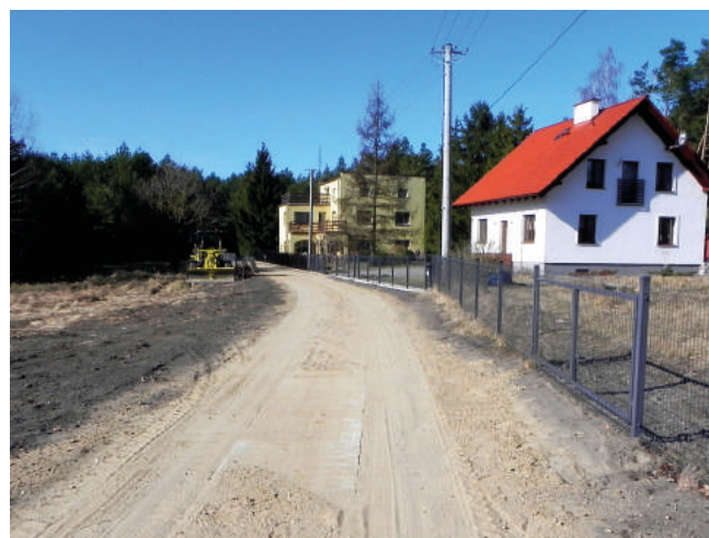
Fragment zmodernizowanej drogi w Sztumskim Polu.

Samorząd planuje ogłoszenie przetargu na modernizację dróg z zastosowaniem płyt jumbo w tym roku obejmującego: Koniecwałd (1000 m), Gościszewo (910 m - za browarem), Nowa Wieś (300 m - od kościoła do starych jumb) i Postolin (1740 m - od drogi powiatowej do tzw. Korei i Ramz).