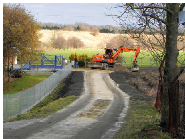
W Piekło przybędzie 203 m drogi z płyt jumbo.