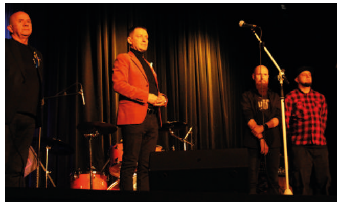
Otwarcie koncertu solidarnościowego grup Worries, Taroth i Abodus.