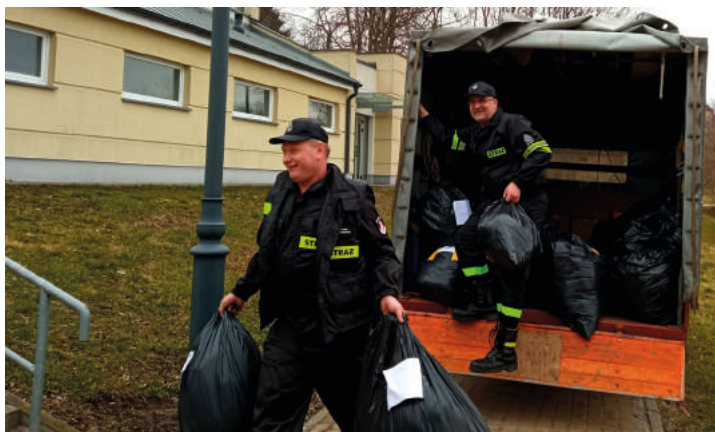
Druhowie z OSP Gościszewo przybyli z transportem odzieży.