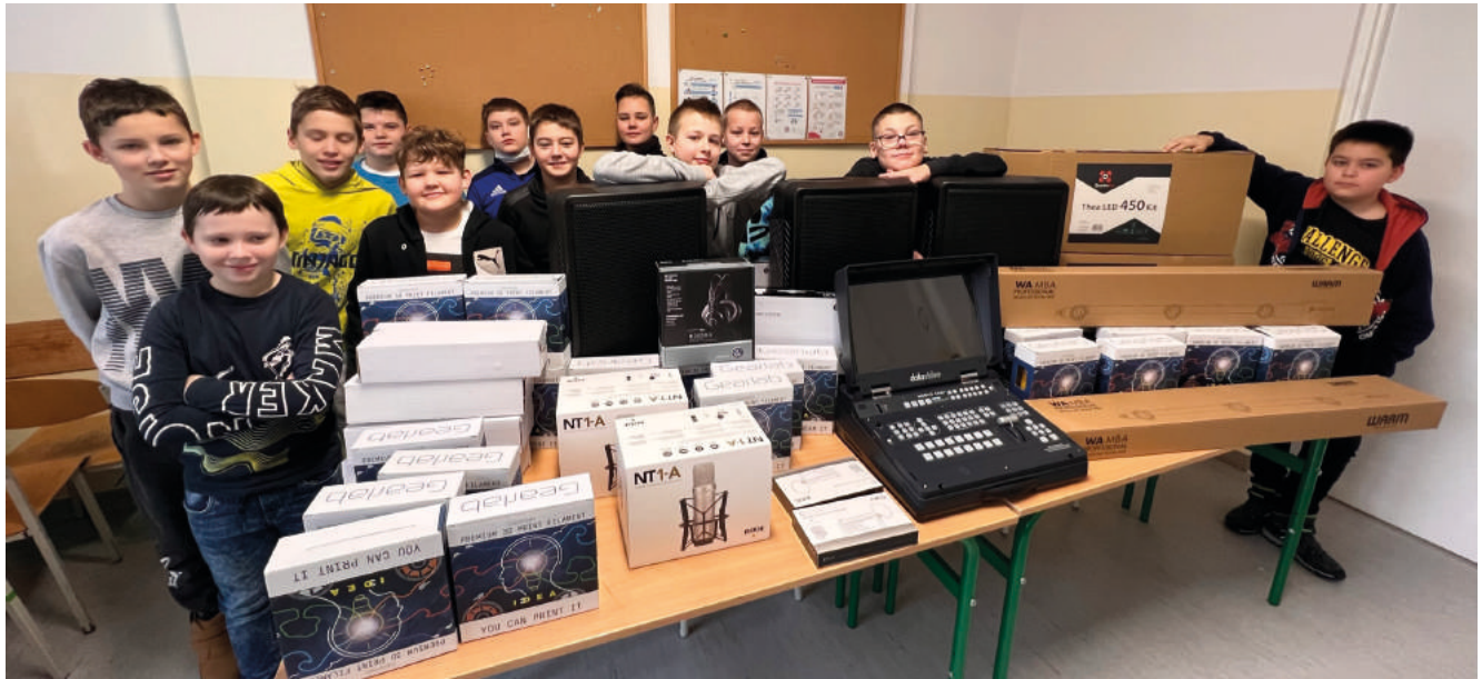
Dzięki programowi szkoła zakupiła sprzęt wysokiej jakości. Na zdjęciu: uczniowie klasy Va.

W ramach programu „Laboratoria przyszłości” Miasto i Gmina Sztum otrzymało 467 tys. zł dofinansowania dla wszystkich 5 szkół podstawowych na zakup nowoczesnego sprzętu, w tym drukarek 3D, mikrokontrolerów, robotów, sprzęt do nagrań i innych nowoczesnych urządzeń dydaktycznych.