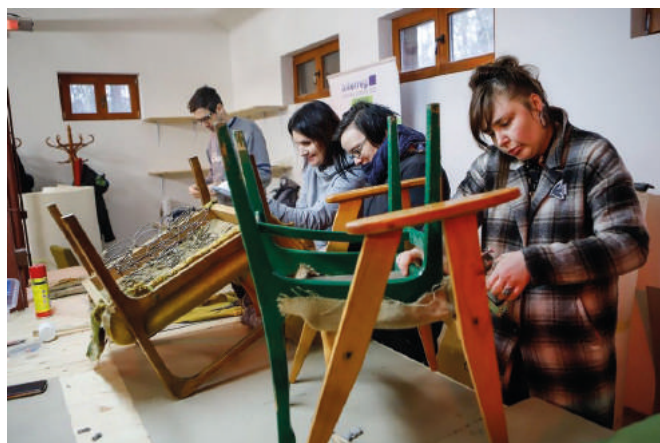
Kawiarenka Naprawcza Stajnia w Toruniu. Można tam przy pomocy specjalistów naprawić uszkodzone przedmioty.

Założeniem projektu jest stworzenie na terenie gminy możliwości do realizacji zasad gospodarki obiegu zamkniętego i ograniczenie ilości odpadów kierowanych do składowania. W ramach projektu planuje się budowę nowoczesnego Punktu Selektywnego Zbierania Odpadów Komunalnych oraz hali magazynowo-naprawczej, do której mieszkańcy będą mogli oddać rzeczy niepotrzebne, a nadające się do ponownego użycia i wykorzystania. Zaplanowano także szeroki zakres działań informacyjno-edukacyjnych. Całkowita wartość projektu to ponad 5 mln zł, z czego przyznane dofinansowanie to 4,3 mln zł. Wkrótce rozpocznie się realizacja projektu.