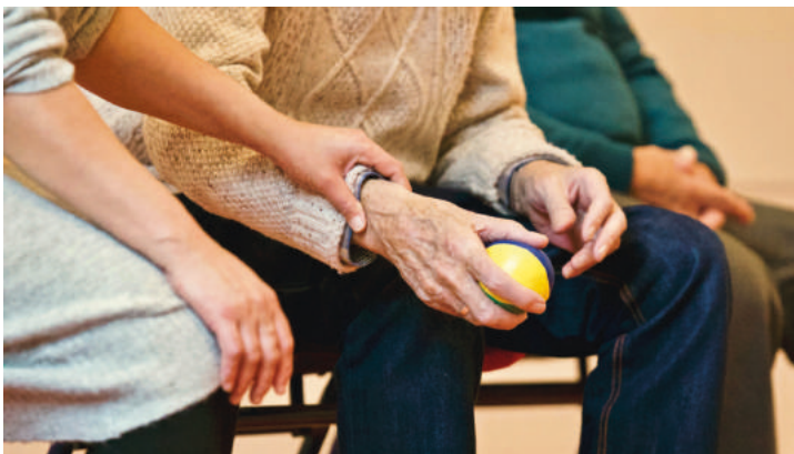
Sztumscy seniorzy korzystają z usług opiekuńczych, asystenta osoby starszej oraz usług telemedycyny.

Zarówno seniorzy, jak i osoby z niepełnosprawnościami i ich opiekunowie mają możliwość skorzystania z indywidualnego poradnictwa w punktach konsultacyjnych.