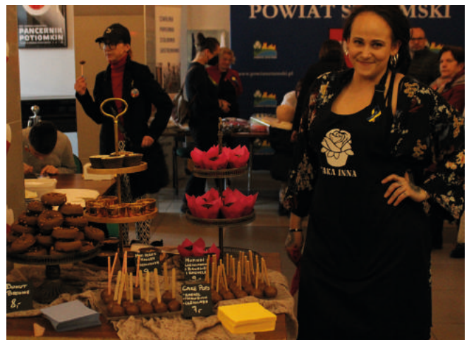
Kiermasz na rzecz uchodźców podczas koncertu „Solidarni z Ukrainą”.