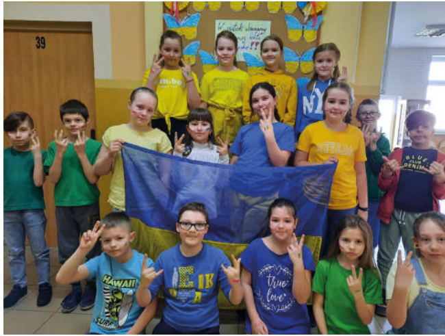
Uczniowie Zespołu Szkół w Czerninie solidarni z Ukrainą.