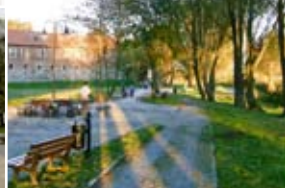
Bulwar Zamkowy w Sztumie