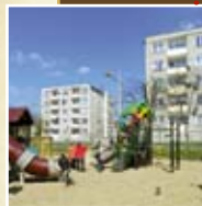
Plac zabaw na bulwarze zamkowym

Z bulwaru podjeżdżamy w lewo pod niewielką górkę do ulicy Władysława Jagiełły, gdzie skręcamy w prawo. Jadąc chodnikiem ok. 150 m dojeżdżamy do skrzyżowania na Kalwę. Skręcamy w lewo kierując się na Barlewice. Odcinek do Kalwy ma długość około 7 km i charakteryzuje się małym ruchem samochodowym.