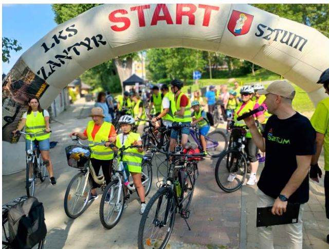
Rozbudowana infrastruktura pozwala na organizowanie imprez różnego rodzaju

Tydzień później plaża stała się areną I Turnieju Siatkówki Plażowej o Puchar Burmistrza Sztumu. W imprezie wystartowało 9 drużyn – 4 kobiece i 5 męskich. Miejsce na boisko trzeba było wygospodarować na plaży, ale możliwość obserwowania widowiskowych rozgrywek z nawiązką zrekompensowała plażowiczom wynikające z tego drobne niedogodności. Efektowne zagrywki, bloki, asy serwisowe i pełne poświęcenia przyjęcia dolne były niewątpliwą atrakcją dla kibiców i wszystkich plażowiczów. Widowiskowe mecze oraz pozostałe atrakcje oferowane przez kąpielisko pozwoliły poczuć się jak na planie serialu Słoneczny Patrol.