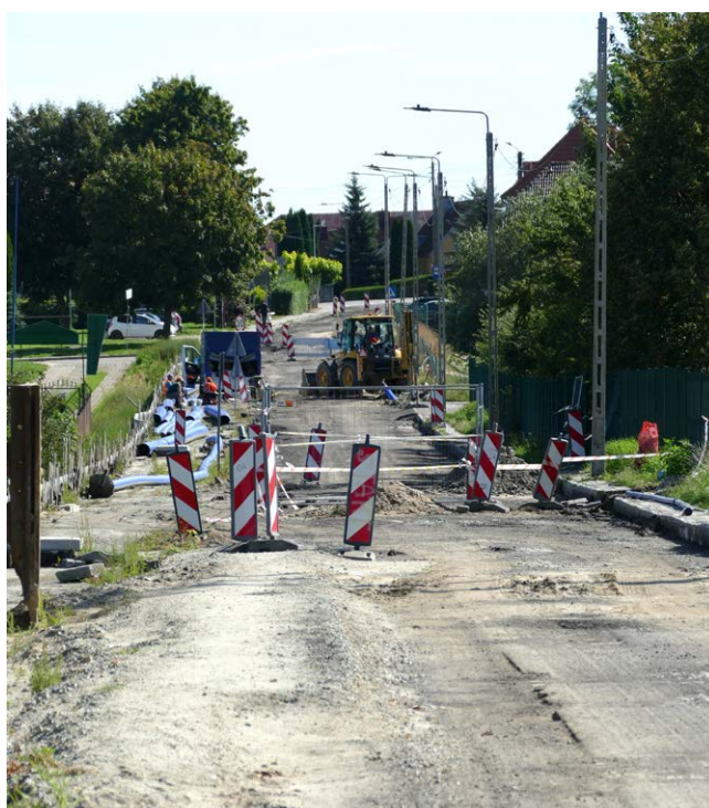
Budowa Węzła wiąże się z koniecznością zamykania kolejnych ulic.

Konieczne trzeba też pamiętać, że węzeł integracyjny to nie tylko drogi i parkingi. To także, a może przede wszystkim, gruntowna modernizacja infrastruktury technicznej