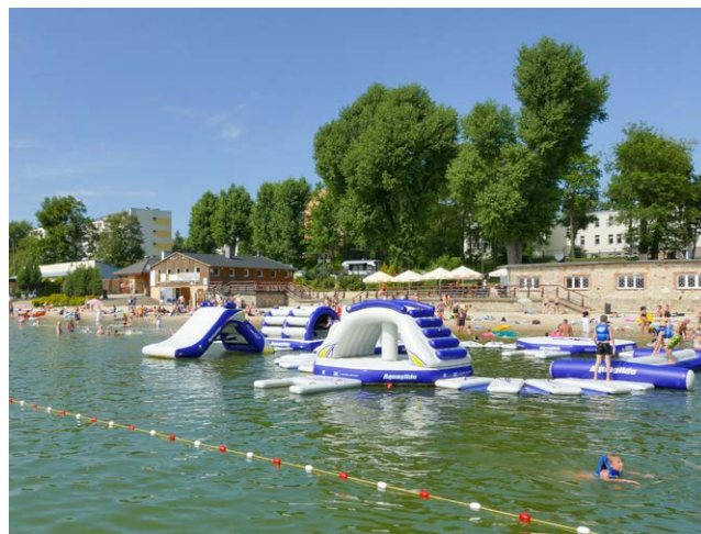
Sztumski Park Wodny od początku cieszył się olbrzymim powodzeniem wśród mieszkańców i gości.