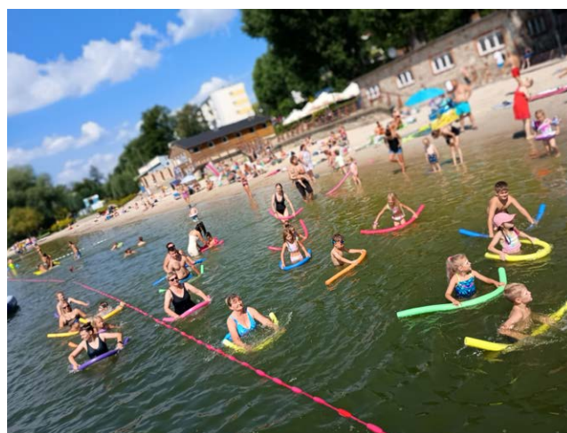
Aquaerobic cieszył się powodzeniem plażowiczów w każdym wieku

już najlepszym kąpieliskiem śródlądowym w południowo-wschodniej części naszego województwa. Wcześniej czy później powinno to przełożyć się na zainteresowanie inwestorów z branży turystycznej, a to oznacza kolejne korzyści dla naszego miasta.