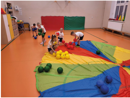
Stymulujemy rozwój psycho-ruchowy