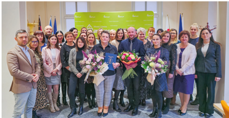
Miejsko-Gminny Ośrodek Pomocy Społecznej jest podstawowym instrumentem dialogu i pomocy Seniorom.

Równie istotne zadanie wykonuje Stowarzyszenie Pomocy Osobom Przewlekłe Chorym „Dar Serca”. Stowarzyszenie od 2014 roku prowadzi Dzienny Ośrodek Wsparcia dla osób powyżej 60 roku życia. Seniorzy przebywający w Ośrodku uczestniczą w zajęciach zwiększających sprawność psychoruchową, rozwijają nowe pasje i zainteresowania. Działalność tej instytucji jest niezwykle ważna wobec wciąż słabo rozwiniętego systemu opieki geriatrycznej i paliatywnej.