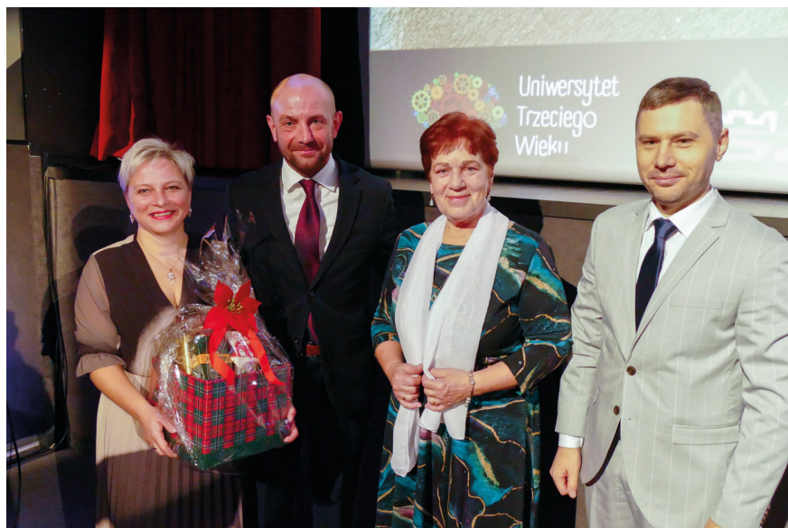
Stowarzyszenie „Labuntur Anni” oraz Klub Senior+ Amator odgrywa istotną rolę w miejskiej polityce senioralnej.

szeroki wachlarz zajęć edukacyjnych, ruchowych i rozrywkowych. Wśród zajęć są takie, które pomagają nadażyć za rozwojem cywilizacyjnym. Zajęcia z informatyki i obsługi komputera gromadzą dużą grupę słuchaczy, chcących rozwijać swoje kompetencje. Jest też trening pamięci, warsztaty z rozwoju osobistego i cała paleta zajęć ruchowych, od jogi do wodnego aerobiku. Olbrzymią popularnością cieszą się zajęcia artystyczne, owocujące koncertami i spektaklami w wykonaniu uczestników. Nie brakuje też amatorów wyjazdów na wydarzenia kulturalne i wycieczki.