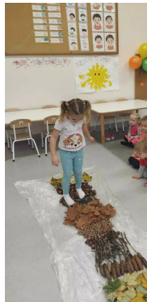
Poznajemy za pomocą zmysłu

Projekt realizowany będzie do końca czerwca 2026 roku.