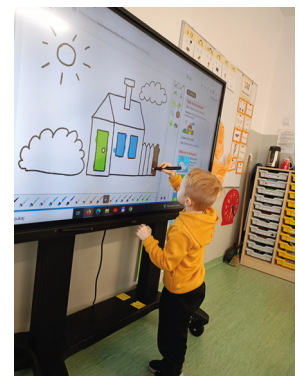
Poznajemy nowe technologie