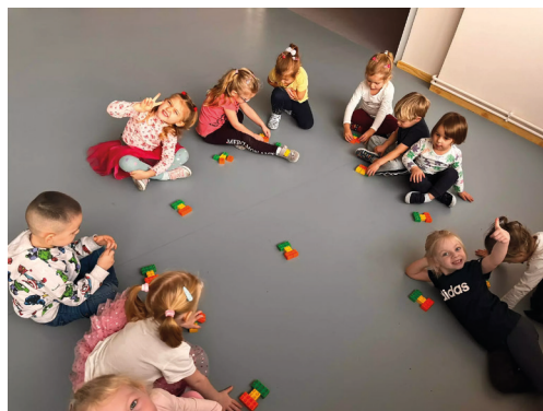
Układamy wg schematu