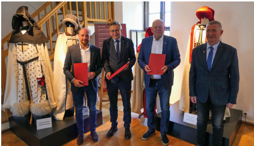
Chcemy w pełni wykorzystać walory historyczne Sztumu, takie jak Zamek w Sztumie.

Chciałbym również podkreślić niezwykłą aktywność naszych seniorów. W listopadzie obchodziliśmy Dni Seniora, a organizacje takie jak Związek Emerytów, Rencistów i Inwalidów, Stowarzyszenie Niewidomych i Niedowidzących, Uniwersytet Trzeciego Wieku oraz Klub Seniora Plus wykazują się ogromną inicjatywą. Ich zaangażowanie dowodzi, że seniorzy są ważną i aktywną częścią naszej społeczności, a my jako samorząd staramy się wspierać ich działania. Podsumowując, edukacja, kultura, sport i pomoc społeczna to dla mnie priorytety. Wspierając te obszary, in-